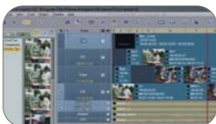
SmartEDIT : une prise en charge multi-format